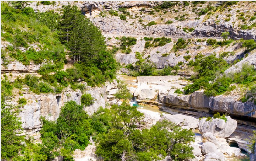
La Méouge (Remi Fabregue)