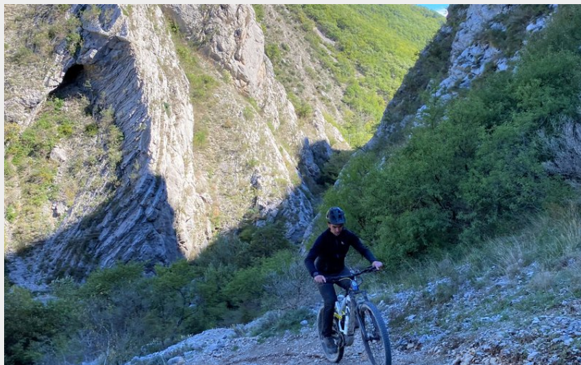
Portion sur sentier (CCSB)