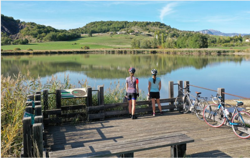
Le lac de Mison (CCSB)