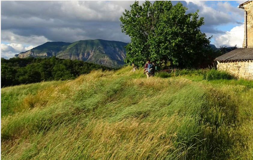
Le Verdillon (Office de Tourisme La Motte du Caire)