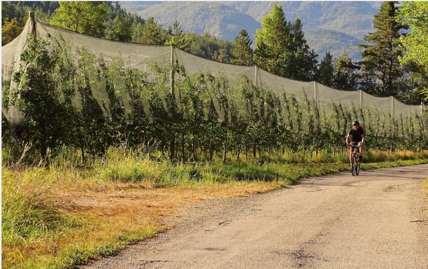
Pédalage en douceur à travers les vergers (Office de Tourisme La Motte du Caire)