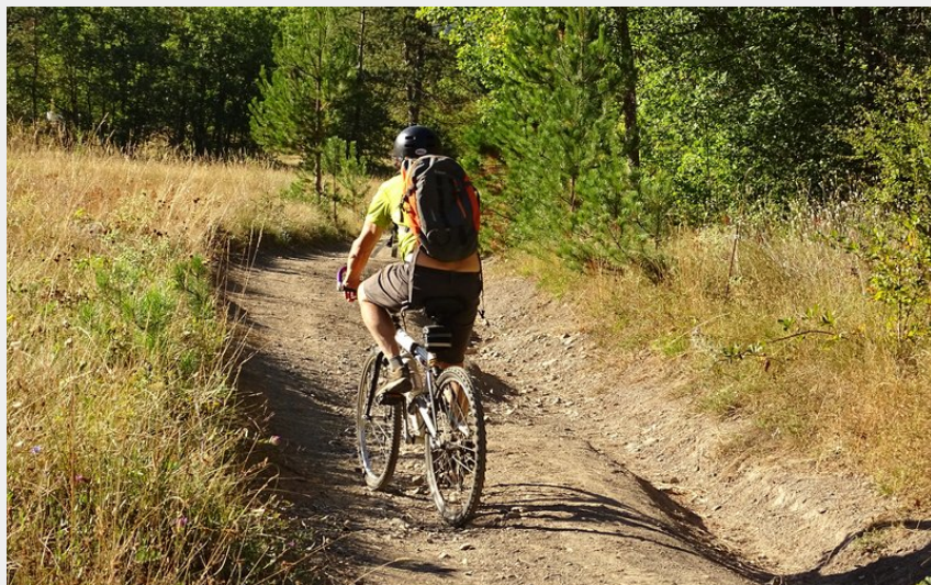
Un itinéraire principalement sur pistes