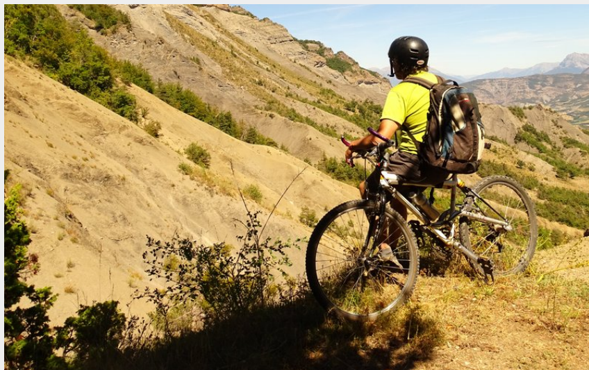
De beaux paysages de moyenne montagne (Office de Tourisme La Motte du Caire)