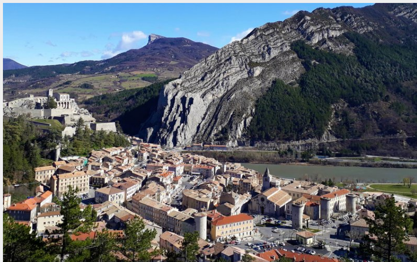
Le sentier surplombe Sisteron (CCSB)