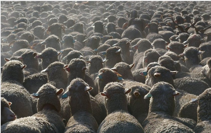
Nombreuses zones de pâturage en chemin