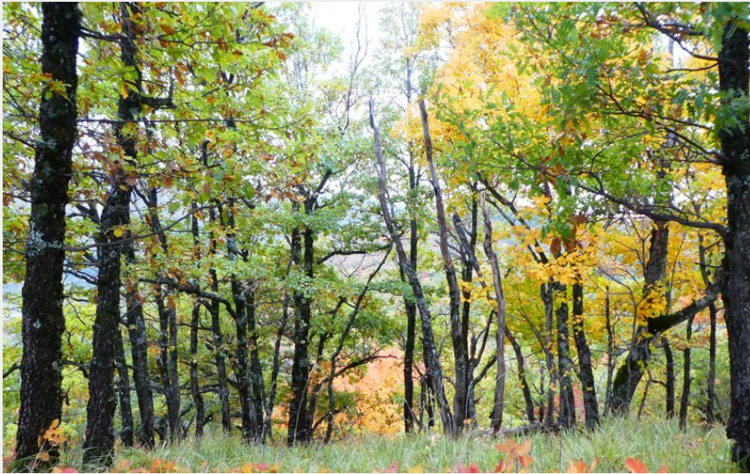
Superbe tapis de feuilles d'automne (CCSB)