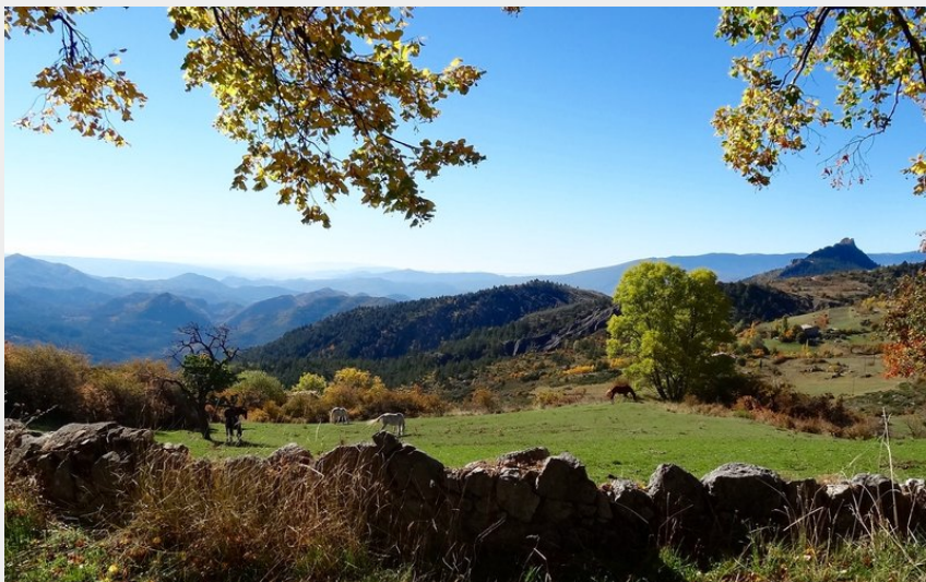
Montée de Saint-Jacques (Office de Tourisme La Motte du Caire)