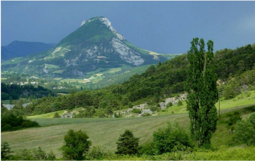
Vue sur le Risou avant l'orage (CCSB)