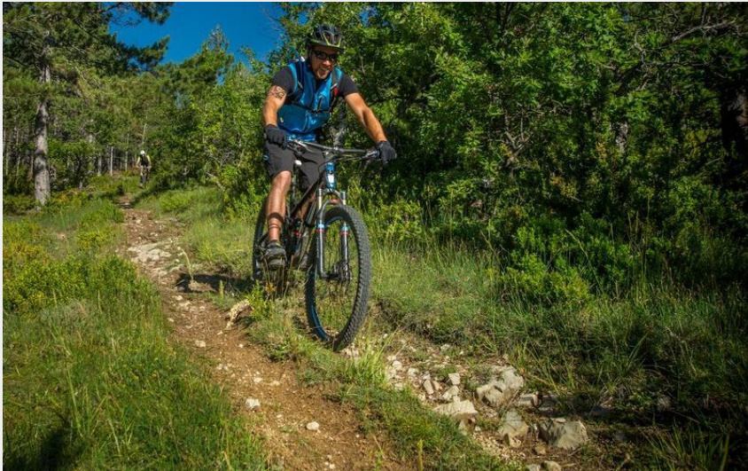
Traversée de la forêt Domaniale de la Méouge à VTT (Espace Rando)